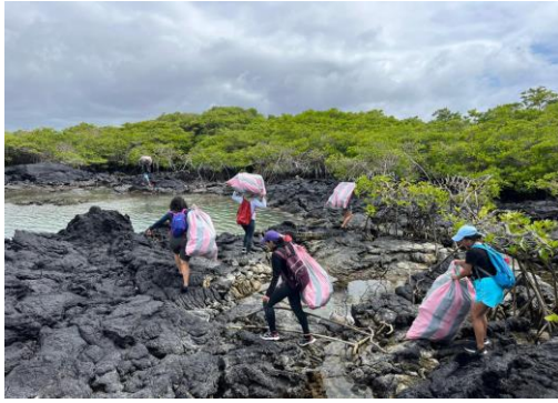
Foto 3. Limpieza costera.