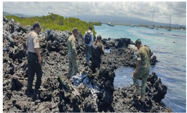
Foto 2. Seguimiento a denuncias.