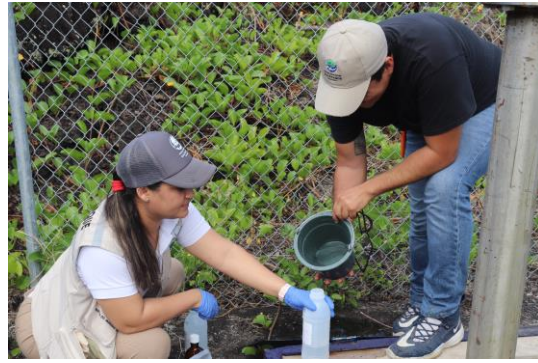
Foto 4. Monitoreo de agua.

Las personas interesadas en la vacante de voluntariado deben enviar los siguientes documentos iniciales para evaluar su aplicación: ficha de aplicación, hoja de vida actualizada y carta al Director de la DPNG vía e-mail a la siguiente dirección voluntarios@galapagos.gob.ec . Los formatos para cumplir con lo dispuesto encontrarán en el link de voluntarios. Si precisan información adicional contactarse al mismo correo electrónico.