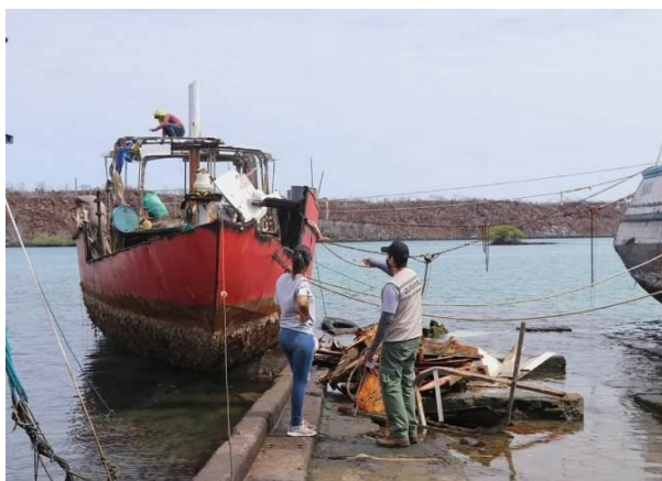
Monitoreo de muelles

Apoyo y participación en el Programa de Limpieza Costera