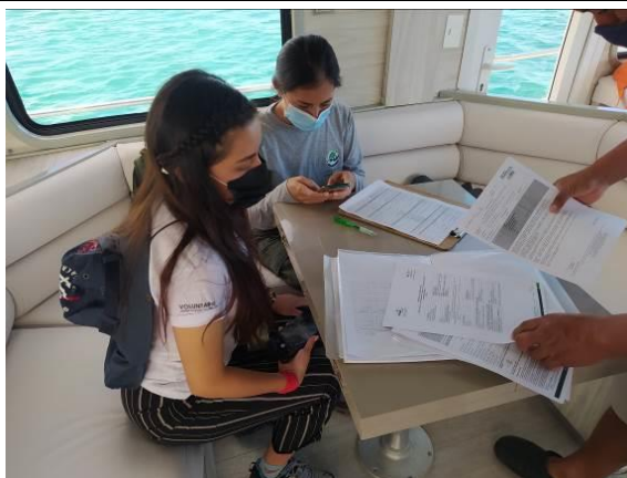
Revisión documental en inspecciones